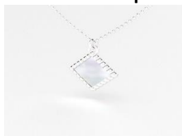
Collier Argent Nacre blanche