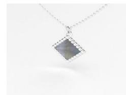
Collier argent nacre grise