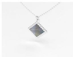
Collier Argent Nacre Noire